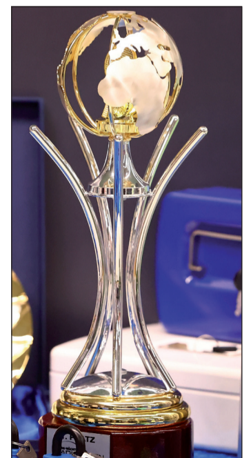
Um diese Trophäe geht es heute Nachmittag im Einzelfinale.